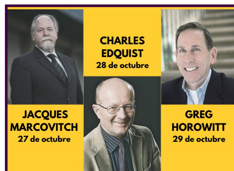
Keynote speakers confirmados