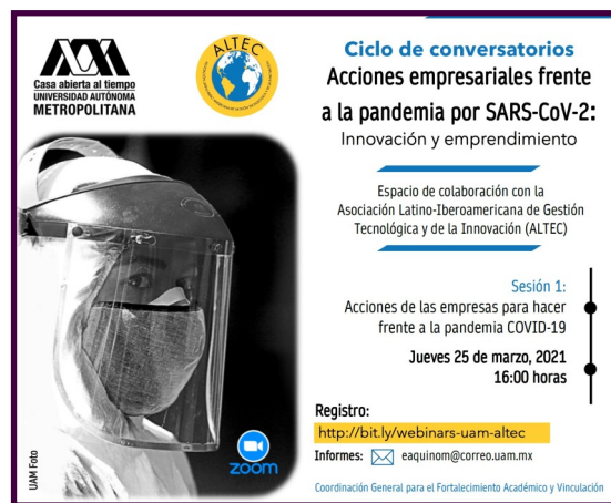
Cartel de difusión de los conversatorios

Estos conversatorios se enmarcan dentro de un plan de acciones de colaboración entre ambas organizaciones, que podrá incluir programas de capacitación y la formación de una red de mentores.