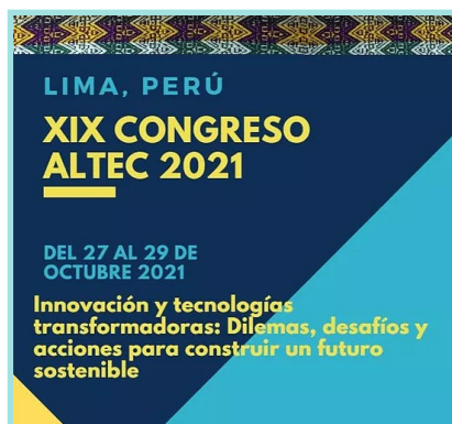
Imagen del próximo Congreso ALTEC 2021