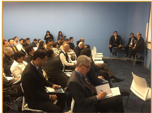
Sesiones del Congreso CITE